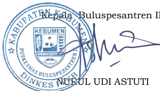
NUROL UDI ASTUTI